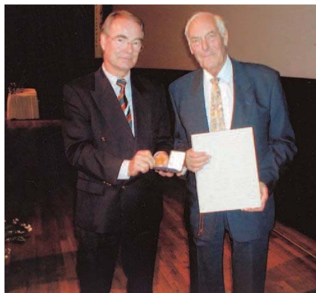
Fig. 1. – Urs Brunner recevant la médaille Max Ratschow (Nuremberg – 2003)

L'œuvre écrite d'Urs Brunner est considérable : aux 330 publications de langue Allemande concernant les artères, les veines, les lymphatiques, les plaies, viennent s'ajouter 32 publications de langue française présentées pour la plupart à la tribune de la Société Française de Phlébologie ou à celle du Collège Français de Pathologie Vasculaire. Le 6 novembre 1999 avait été organisé à l'Hôpital Universitaire de Zurich un colloque en l'honneur d'Urs et auquel je fus invité en ma qualité de Président de l'Union Internationale de Phlébologie. Ce fut pour moi l'occasion d'insister sur la contribution importante d'Urs à la phlébologie francophone car il sut établir le lien nécessaire entre la phlébologie de langue allemande et la phlébologie de langue française. La part éminente qu'il avait prise à la vie de la Société Française de Phlébologie et à celle du Collège Français de Pathologie Vasculaire m'incita à centrer mon exposé sur l'analyse exhaustive de la bibliographie francophone d'Urs Brunner, démontrant ainsi que son insigne mérite avait été de jeter un pont entre deux cultures tant au plan relationnel qu'au plan scientifique, surtout que germanophones et francophones ont beaucoup à se dire mutuellement et malheureusement se trouvent souvent séparés par l'obstacle linguistique. Aussi me permet-trai-je ici de rappeler le déroulement méthodique de ses publications de langue française.