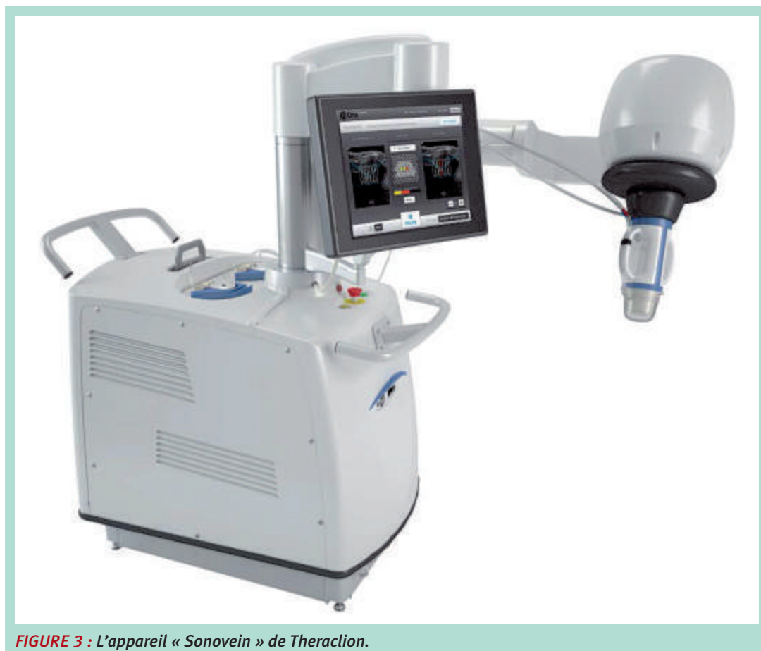
FIGURE 3 : L'appareil « Sonovein » de Theraclion.