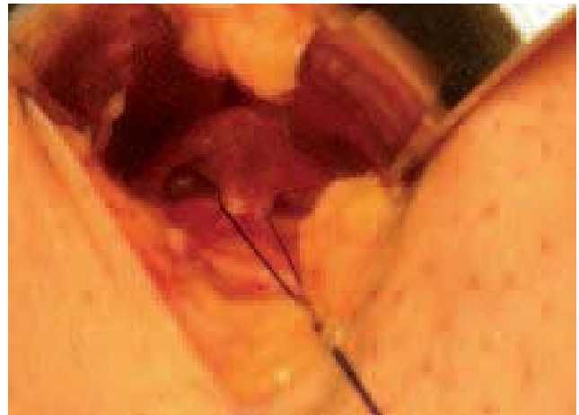
Photo 1. – Voie d'abord latérale en dehors de la zone cicatricielle et de la lame lympho-ganglionnaire

De cette façon, par une voie d'abord très petite et très oblique, on peut accéder à la veine fémorale et la suivre jusqu'à la base de l'ancienne JSF. Pendant de nombreuses années, nous avons lié et sectionné entre