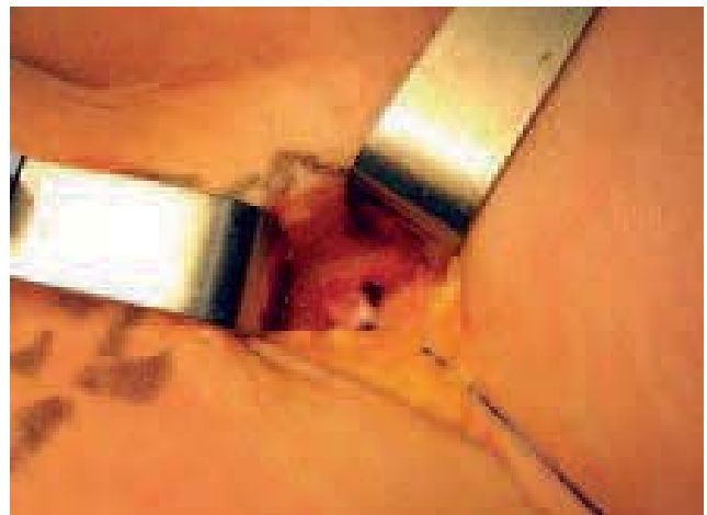
Photo 2. – Double ligature de prolène sur le moignon résiduel au ras de la veine fémorale

Aujourd'hui, depuis 2000, nous avons réduit encore la dissection en mettant simplement en place une double ligature de prolène au ras de la veine fémorale (Photo 2). Cela nous permet d'injecter de façon sécurisée de la mousse dans la néovascularisation (NV), directement ou par l'intermédiaire d'un tronc résiduel, afin de fermer toutes les communications veineuses situées distalement par rapport à la ligature de prolène faite au ras de la veine fémorale. L'injection par l'incision de reprise de crossectomie est faite par une aiguille 25 Gauge à l'extrémité d'un prolongateur afin d'éviter tout déplacement de l'extrémité de l'aiguille pendant l'injection (Photo 3). Cette mini-dissection sans bistouri électrique, sans drainage post-opératoire, a pour but de diminuer le traumatisme, source d'hématomes et de phénomènes inflammatoires. Certaines études ont montré que la nouvelle NV était plus importante dans la chirurgie de la récurrence (plus traumatique) que dans la chirurgie des varices, lorsque l'intervention était faite de façon traditionnelle, c'est-à-dire avec une large dissection de la région fémorale [2].