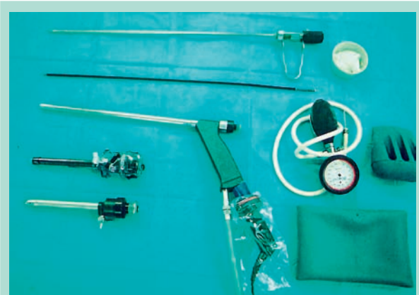
FIGURE 6 : Matériel chirurgical pour ligature endoscopique des perforantes.

92 perforantes ont été ligaturées associées à 25 éveinages partiels et 22 phlébectomies. Une contention de classe 2 a été installée par bas et une thromboprophylaxie sous-cutanée pendant 10 à 15 jours a été prescrite ainsi que des antalgiques mineurs de type paracétamol. Les patients quittaient l'établissement le lendemain de l'intervention.