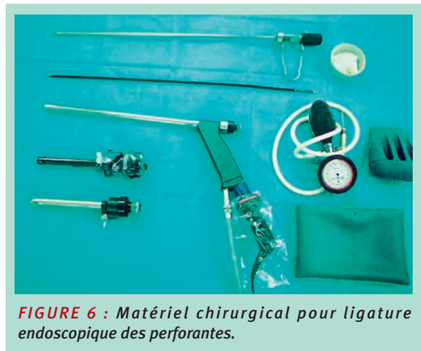
FIGURE 6 : Matériel chirurgical pour ligature endoscopique des perforantes.

92 perforantes ont été ligaturées associées à 25 éveinages partiels et 22 phlébectomies. Une contention de classe 2 a été installée par bas et une thromboprophylaxie sous-cutanée pendant 10 à 15 jours a été prescrite ainsi que des antalgiques mineurs de type paracétamol. Les patients quittaient l'établissement le lendemain de l'intervention.