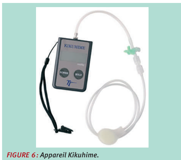
FIGURE 6: Appareil Kikuhime.

La pression a été notée en position couchée, puis debout et après 5 minutes de marche, les mesures ont été prises 3 fois et leur moyenne a été calculée.