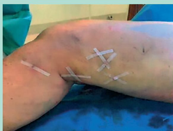
FIGURE 1: Incisions de micro-phlébectomies fermées par des stéristrips.