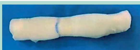
FIGURE 2: Le dispositif de compression.