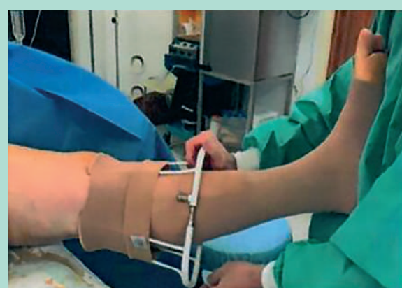
FIGURE 4: Enfile-bas.

Le dispositif est fixé par le sparadrap, avant d'appliquer le bas de compression 23-32 mmHg à la cheville (Jobst Relief autofixant à la cuisse) ( Figure 4 et Figure 5 ).