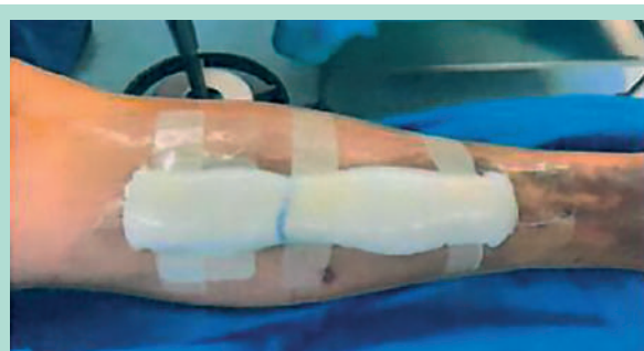
FIGURE 3: Dispositif fixé sur le pansement.