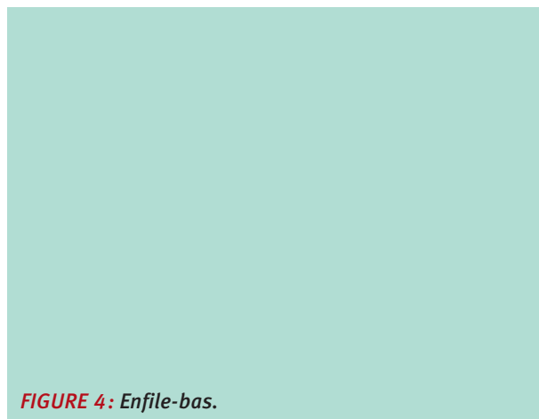
FIGURE 4: Enfile-bas.

Le dispositif est fixé par le sparadrap, avant d'appliquer le bas de compression 23-32 mmHg à la cheville (Jobst Relief autofixant à la cuisse) (Figure 4 et Figure 5).