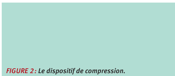
FIGURE 2: Le dispositif de compression.