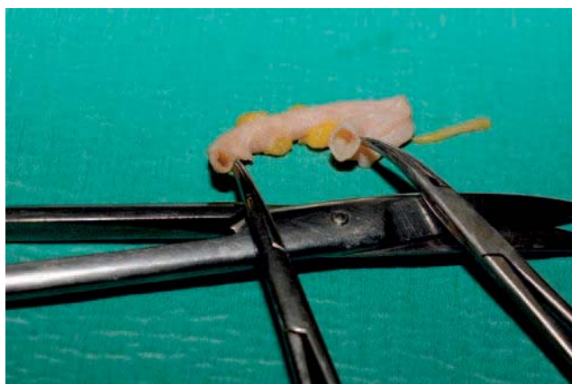
Fig. 1. - Aspect de veine chauffée in vitro

Microscopiquement, il existe une destruction complète de la couche endothéliale et un élargissement marqué de la media, avec fibres de collagène détricotées (Fig. 2).