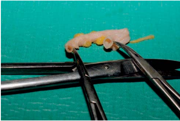
Fig. 1. - Aspect de veine chauffée in vitro

Microscopiquement, il existe une destruction complète de la couche endothéliale et un élargissement marqué de la media, avec fibres de collagène détricotées (Fig. 2).