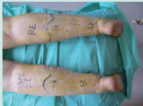
FIGURE 2 : Anesthésie tumescence.

Cette tumescence permet de réaliser une anesthésie très efficace et de doubler l'épaisseur de la zone de travail (4,5).L'utilisation d'une aiguille de Klein permet de rendre ce temps plus rapide et contribue à provoquer une tunnelisation de la zone.