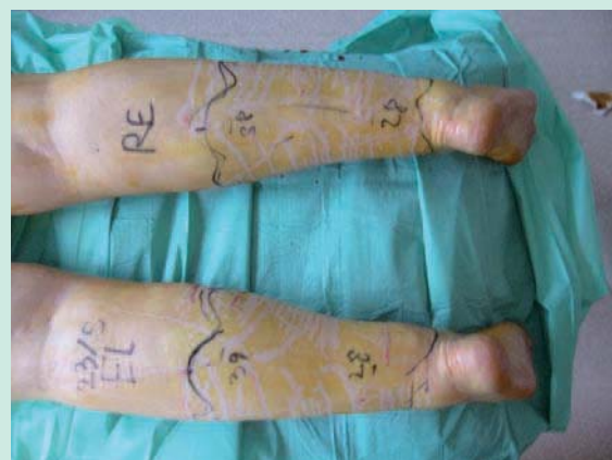
FIGURE 2 : Anesthésie tumescence.

Cette tumescence permet de réaliser une anesthésie très efficace et de doubler l'épaisseur de la zone de travail (4,5).L'utilisation d'une aiguille de Klein permet de rendre ce temps plus rapide et contribue à provoquer une tunnelisation de la zone.