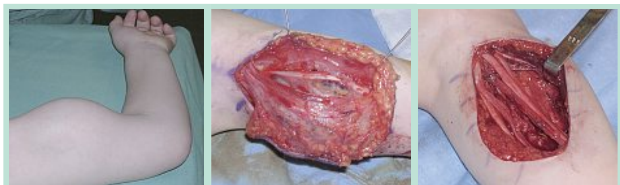
FIGURE 4 : Exérèse totale d'une MV du bras refoulant le canal brachial.