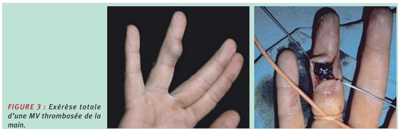
FIGURE 3 : Exérèse totale d'une MV thrombosée de la main.

En cas de MV symptomatique présentant des contre-indications à la sclérose, comme la proximité d'éléments nobles, la présence de veines de drainage de trop gros calibre avec un drainage dans le réseau profond, une MV très diffuse ou de grande taille, la chirurgie est indiquée. Si la lésion est bien limitée elle sera enlevée en totalité en prenant soin de ne pas léser les éléments nobles ( Figure 4 ).