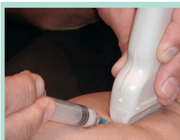
FIGURE 2 : Injection de la petite veine saphène sous contrôle échoguidé.

Celle-ci a été obtenue en mélangeant à l'aide d'un dispositif EASYFOAM 0,5 cc de solution de lauromacrogol 400 à 3 % à 2,5 cc d'air.