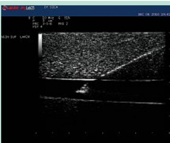
PHOTO 5 : Visualisation de l'aiguille en position endoluminale dans la saphène artificielle.