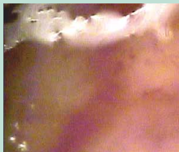
FIGURE 3 : Télangiectasie rouge de jambe, œdème périveinulaire caractérisé par le flou, faible sinuosité.

Elles sont de type rouge et moins sensible à la sclérothérapie. Leurs aspects évoquant comme il l'a été décrit précédemment une atteinte du tissu périveinulaire. Des auteurs italiens ont récemment proposé d'injecter de l'acide hyaluronique en périveinulaire afin de les traiter.