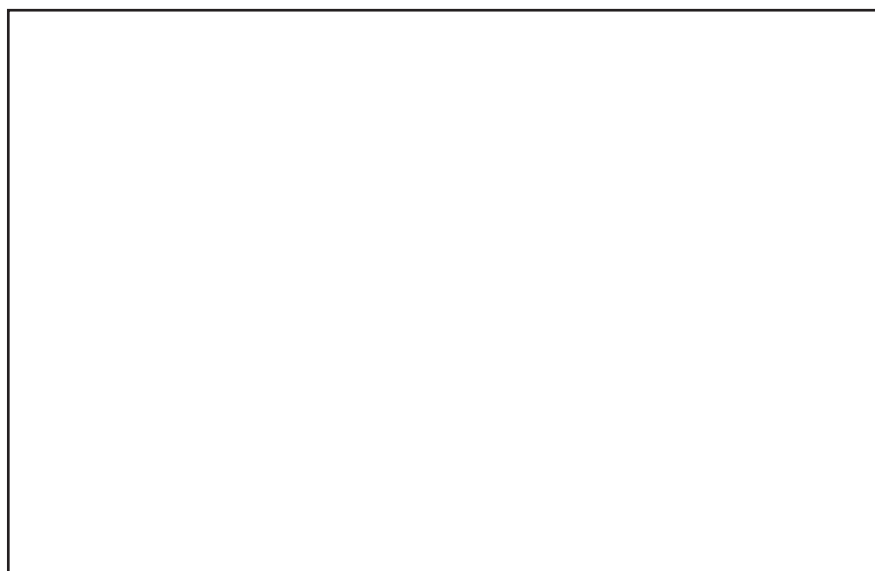
(A). Nombre de cas équilibrant le risque entre les effets secondaires graves potentiels liés au vaccin et les avantages liés au vaccin évitant les décès liés à la COVID-19