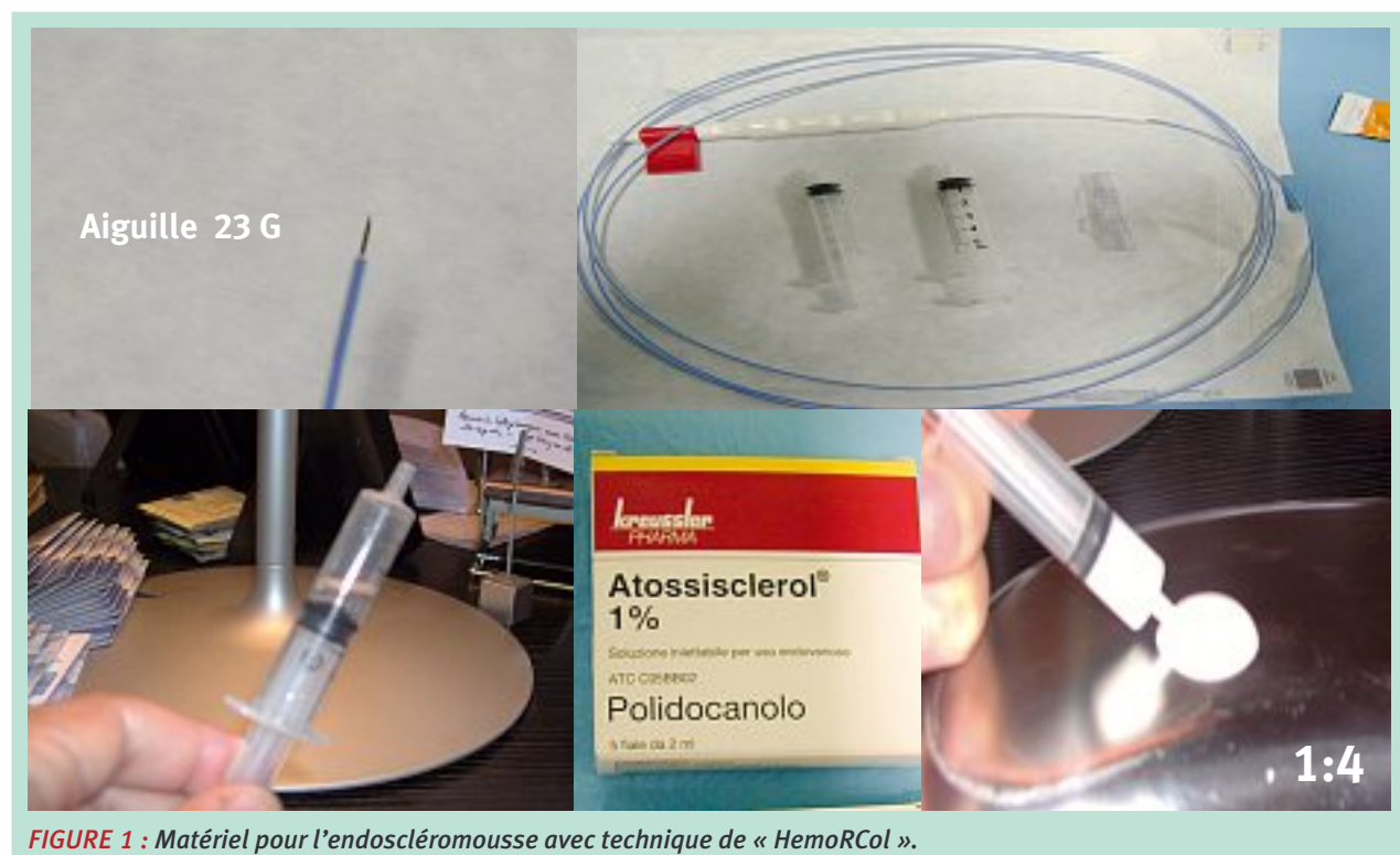
FIGURE 1 : Matériel pour l'endoscléromousse avec technique de « HemoRCol ».

À chaque visite, des données ont été recueillies au moyen d'un questionnaire de qualité de vie et d'une échelle normalisée de douleurs sur le nombre d'épisodes de saignement, sur l'aggravation des hémorroïdes, sur la douleur et sur l'inconfort.