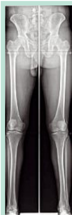
FIGURE 2 : Téléradiographie des membres inférieurs avec axe.