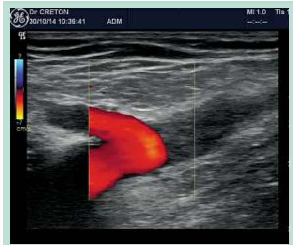
FIGURE 5 : Image écho-Doppler couleur postopératoire d'une TEV (ClosureFast™).

– mais on peut faire ce stripping avec une simple phlébectomie inguinale si les circonstances anatomiques le permettent, pour extérioriser le tronc en-dessous de la crosse, afin de réaliser le stripping habituel de haut en bas à l'aide d'un pin-stripper.