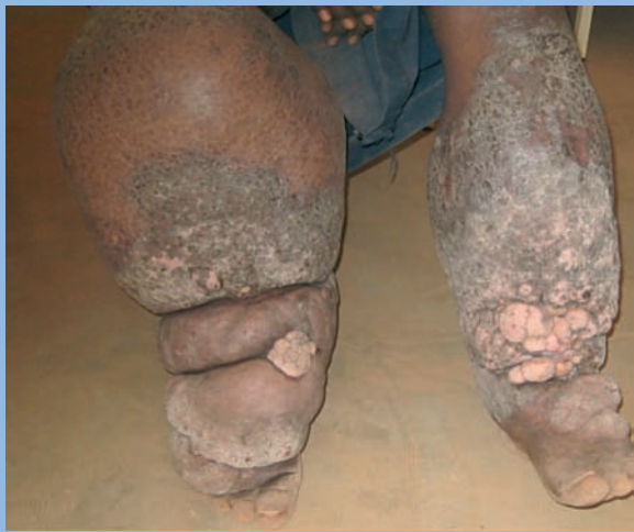
FIGURE 3 : Éléphantiasis bilatéral, prédominant à droite, chez un jeune de 20 ans, à qui on a proposé une amputation (prévue fin février 2009). Donnez une dimension du mollet gauche... Je ne pouvais en faire le tour avec mes bras !