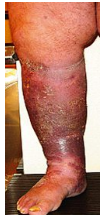
Photo 2. – Troubles trophiques au cours d'une obésité morbide (IMC 65) sans reflux veineux

Pour le prouver, une association entre l'obésité morbide, la pression intra-abdominale et l'hémodynamique veineuse par mesure de la pression veineuse par cathétérisation ilio-fémorale a été recherchée [5, 6]. Il apparaît que la pression veineuse est directement corrélée à la pression intra-abdominale dans l'obésité morbide, avec une pression ilio-fémorale trois fois supérieure chez l'obèse par rapport à celle des sujets de poids normal. Cependant, la relation entre l'hyperpression veineuse et le développement des oedèmes et des troubles trophiques reste à définir. Sugarman [7] a montré que les ulcérations de jambe sont associées de