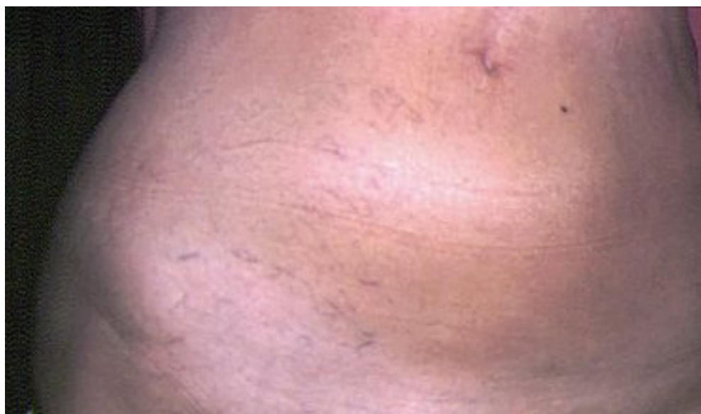
Photo 2. – Varicosités sur l'hémi-abdomen apparues chez une jeune patiente quelques mois après une crossectomie