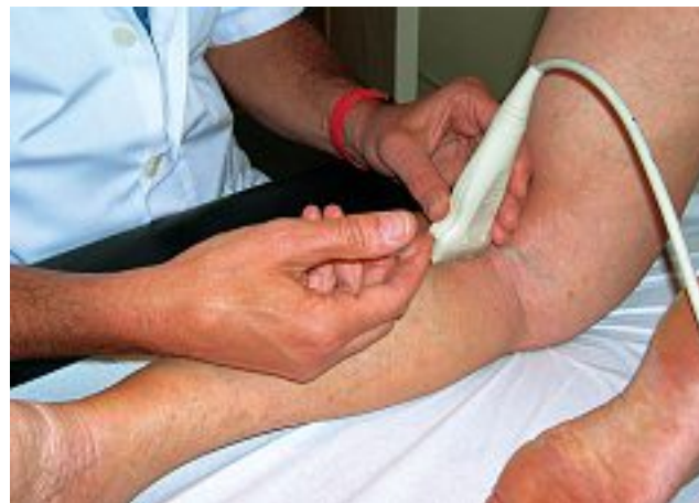
Photo 3. – Injection de la petite veine saphène sous contrôle écho-guidé

présentée avec R. Knight, lors du Congrès mondial de Strasbourg en 1989 [7]. L'échographie faisait son apparition dans la pratique phlébologique et, compte tenu du nombre d'accidents d'injections intra-artérielles constatées chez des praticiens expérimentés, l'idée nous est venue de sécuriser cette injection. Réalisée sous contrôle écho-guidé, elle permettait d'avoir un double contrôle : un contrôle clinique par reflux de sang dans la seringue et un contrôle échographique avec visualisation de l'aiguille dans la lumière veineuse et du passage du produit sclérosant dans la lumière veineuse.