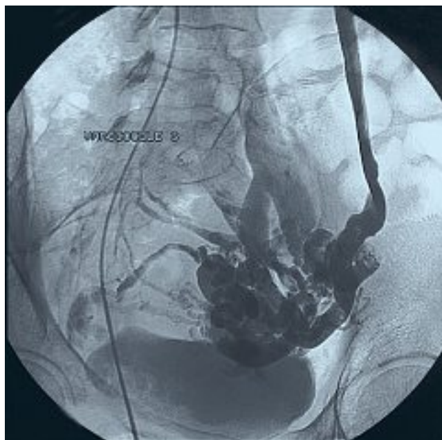
Fig. 1. – Varicocele gauche type 1 secondaire à une pathologie de reflux du sang veineux rénal gauche dans la veine ovarique gauche. Noter l'opacification homogène de la veine rénale gauche sur tout son trajet