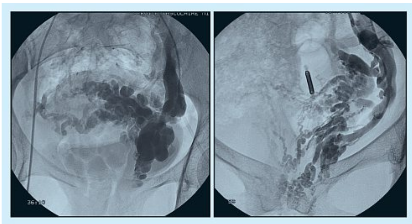
Fig. 4. – Varices pudendales internes gauches

Le traitement des varicocèles a été rapporté dans de nombreux articles [8-10]. La technique que nous utilisons préférentiellement exige une bonne maîtrise des colles chirurgicales qui polymérisent en quelques secondes au contact du sang pour former un conglomerat imperméable à toutes substances organiques. Le résultat est définitif. Elle associe des coils permettant de bloquer le flux des principaux afférents ovariens au paramètre suivi, après constatation de la stase du flux par injection à la main d'une faible quantité de produit de contraste, de l'embolisation de la veine génitale par une émulsion de colle chirurgicale et de lipiodol. Les afférents iliaques internes incontinents injectant la varicocèle sont également embolisés.