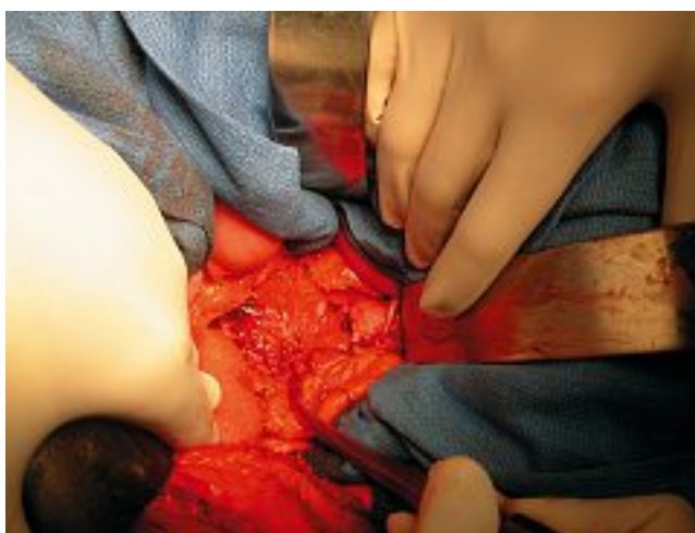
Fig. 5. – Vue opératoire montrant la résection complète de la tumeur et de la veine cave inférieure inter-rénale et rétro-hépatique