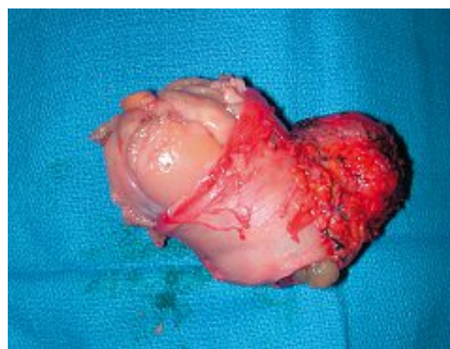
Fig. 6. – Pièce opératoire : vue macroscopique du léiomyosarcome de la veine cave inférieure

Macroscopiquement, les léiomyosarcomes de la VCI sont des tumeurs lobulées, avec une pseudocapsule fibreuse externe (Fig. 6). L'examen histologique montre habituellement une prolifération fasciculée de cellules fusiformes allongées, avec tourbillons et formations palissadiques. La présence de gros noyaux hyperchromatiques et de nombreuses mitoses rend habituellement évidente la malignité de ces tumeurs [5].