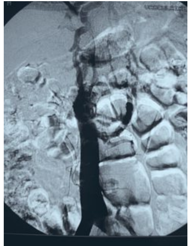
Fig. 3. – Cavographie inférieure montrant l'occlusion complète de la veine cave inférieure supra-rénale et la circulation collatérale

(Fig. 1). La tumeur remontait au niveau de la VCI rétro-hépatique où elle présentait un développement intravasculaire (Fig. 2). Une cavographie montrait une occlusion complète de la VCI supra-rénale (Fig. 3).