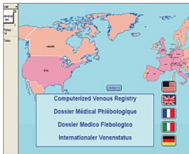
Fig. 1. – Fenêtre d'ouverture du programme CVR

Les données CEAP sont constituées par : les signes Cliniques qui sont répartis en 7 classes, de C0 à C6. Le C0 correspond à l'absence de signe, C6 au signe ultime qui est l'ulcère en phase évolutive (Tableau 1). Pour les symptômes, l'indice S (Symptomatique) ou A (Asymptomatique) positionné à la suite du numéro de la Classe, permet d'individualiser leur présence ou leur absence. Les trois autres composants de CEAP sont :