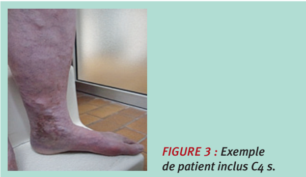
FIGURE 3 : Exemple de patient inclus C4 s.