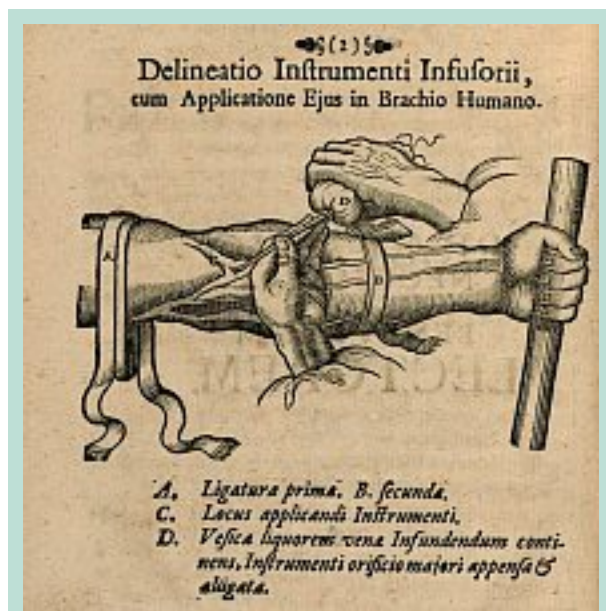
FIGURE 1 : Technique d'infusion en 1664.

En 1661, J.S. Elscholtz injecte à l'aide d'une canule et d'une poire de l'eau de plantain (modeste plante des prairies) à trois soldats victimes d'abcès ou de scorbut et qui guérissent. C'est l'infusion médicamenteuse que l'on pratique généralement après dénudation de la veine [3].