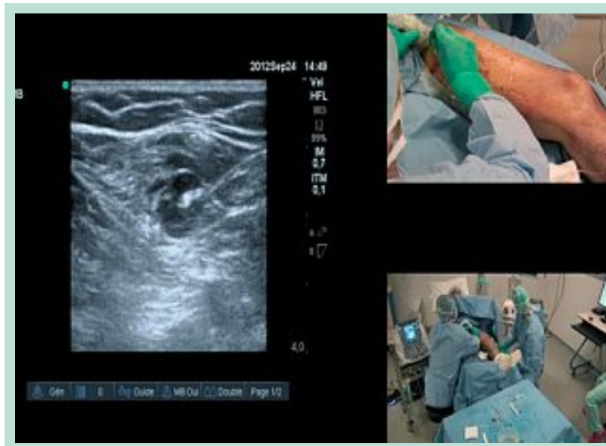
FIGURE 2 : Tumescence sous guidage échographique avec réalisation d'un manchon liquidien hypo-échogène entraînant un spasme de la veine autour de la fibre laser.