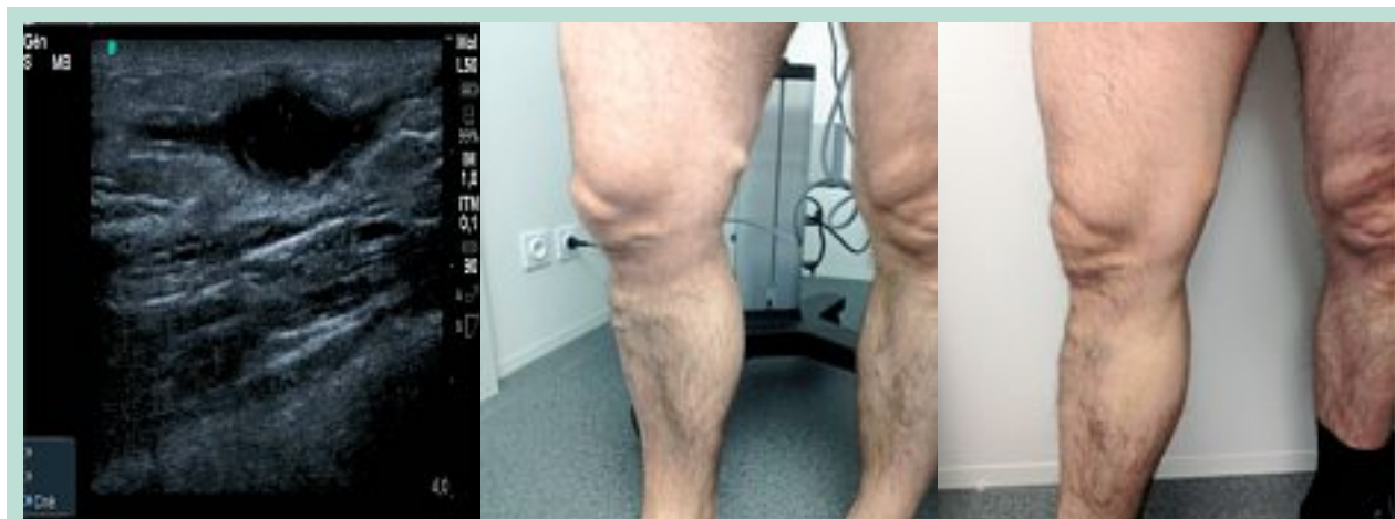
FIGURE 3 : Ectasie variqueuse franchie par laser endoveineux avant traitement et 8 jours après traitement.

La tumescence est également un élément qui permet d'augmenter cette distance.