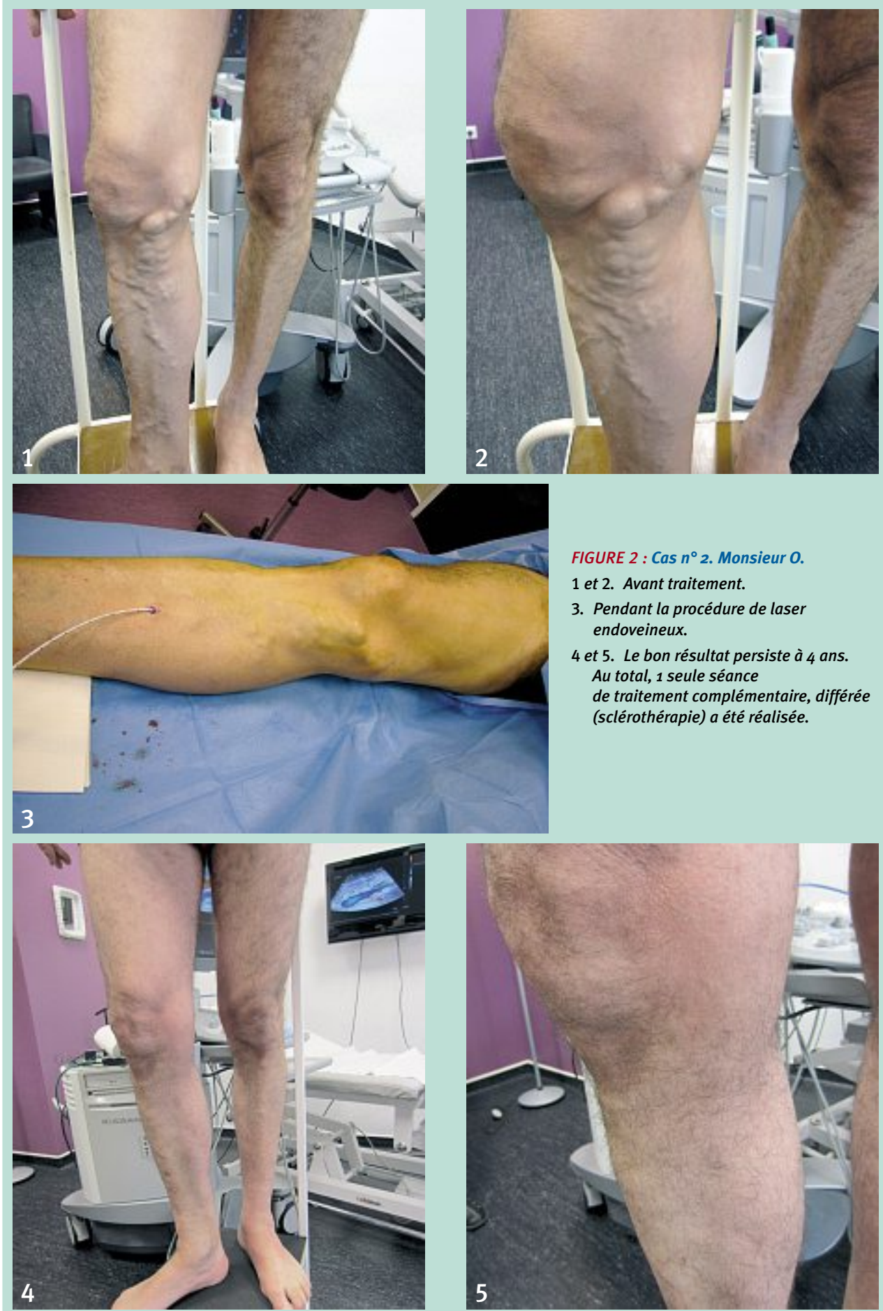
FIGURE 2 : Cas n° 2. Monsieur O.