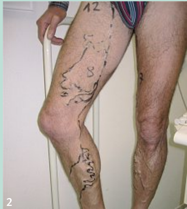
FIGURE 1 : Cas n° 1. Monsieur J.