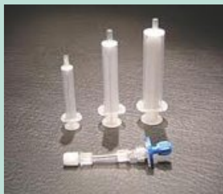
FIGURE 8 : Sterivein.

Pour mieux expliquer et/ou comprendre l'intérêt récent de la communauté phlébologique pour les mousses sclérosantes, il faut vraiment avoir à l'esprit ce que représente l'utilisation d'un sclérosant liquide transformé sous forme de mousse [2].