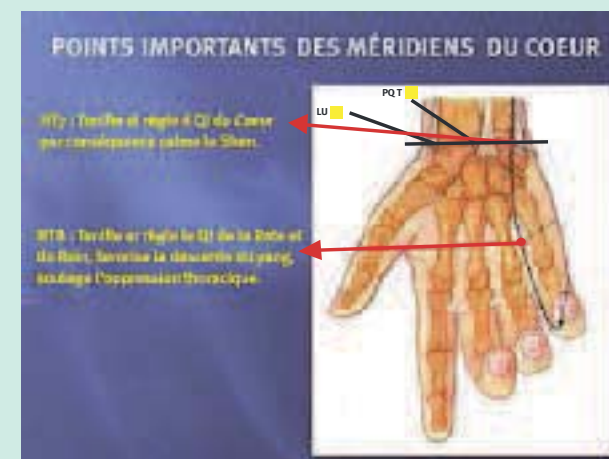
FIGURE 3 : Points importants des méridiens du cœur situés sur la main.