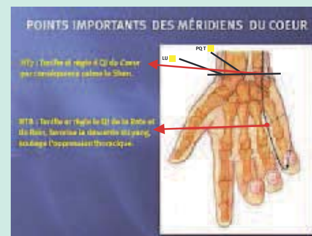
FIGURE 3 : Points importants des méridiens du cœur situés sur la main.