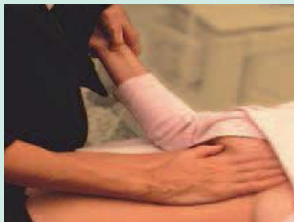
FIGURE 2 : Points importants des méridiens du cœur situés sur la main et l'avant-bras.