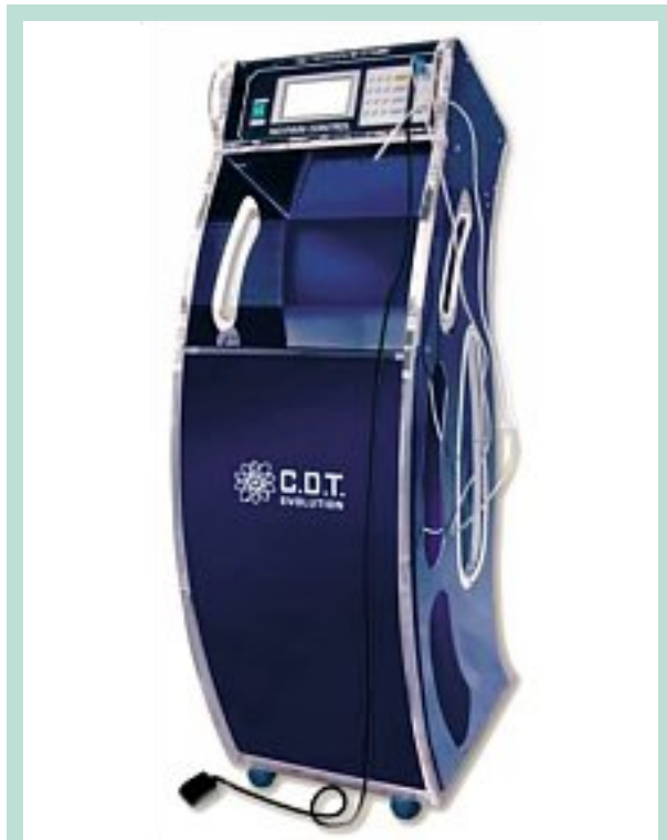
FIGURE 1 : Carbomed CDT Evolution.