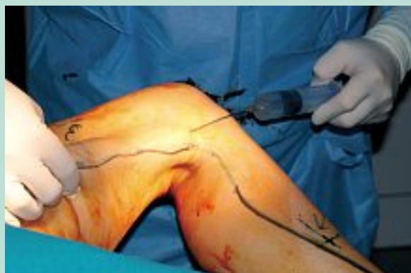
FIGURE 13 : Remonter vers la fosse inguinale en injectant en même temps.