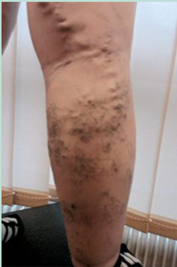
FIGURE 2 : Varice non systématisée pseudo-angiomaticuse.