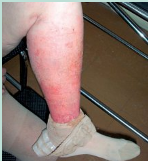
FIGURE 6 : Œdème exsudatif.

Le remplacement du bas par un manchon en néoprène, inextensible dont la pression est ajustable au moyen de fermetures Velcro, peut également être une solution pratique.