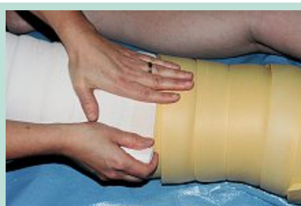
FIGURE 4 : Mise en place des bandes à allongement court (Somos®) avec lissage sur le capitonnage pour un lymphœdème du membre inférieur.

Les compressions élastiques, dont le port n'est pas facilement accepté, sont indispensables au long cours pour maintenir le bénéfice obtenu après la réduction de volume obtenue par les bandages peu élastiques lors de la phase intensive [7, 20].