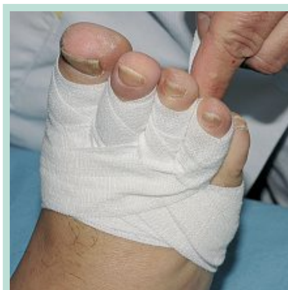
FIGURE 2 : Bandage des orteils avec une bande Somos® de 3 cm de large.