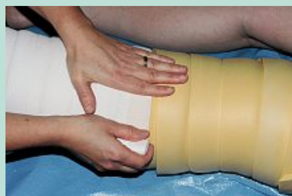
FIGURE 4 : Mise en place des bandes à allongement court (Somos®) avec lissage sur le capitonnage pour un lymphœdème du membre inférieur.

Les compressions élastiques, dont le port n'est pas facilement accepté, sont indispensables au long cours pour maintenir le bénéfice obtenu après la réduction de volume obtenue par les bandages peu élastiques lors de la phase intensive [7, 20].