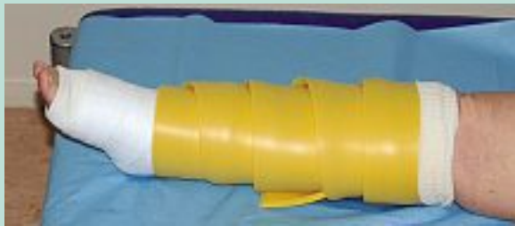
FIGURE 3 : Mise en place du capitonnage par ouate et mousse.

Les études concernent essentiellement les lymphœdèmes du membre supérieurs après cancer du sein mais peuvent raisonnablement être extrapolées aux membres inférieurs.