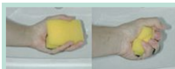
FIGURE 3 : Simulation de l'efficacité du drainage lymphatique manuel.

Les séances de kinésithérapie ne doivent pas durer moins de 30 minutes [17, 18, 19, 24].