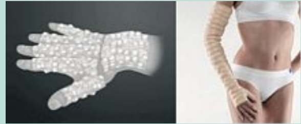
FIGURE 6 : Gantelet et manchon Mobiderm®.

La réussite du traitement sera jugée sur la transformation de l'œdème, pour passer d'un stade « œdème induré » à un stade « plus souple ».