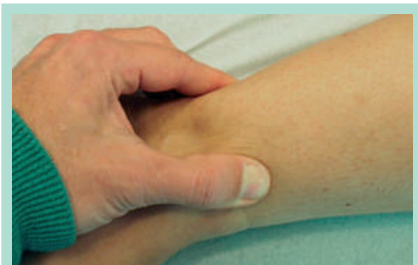
FIGURE 2 : Signe spécifique du lipœdème. En cas de difficulté diagnostique, l'échographie de haute résolution apporte de précieux renseignements.