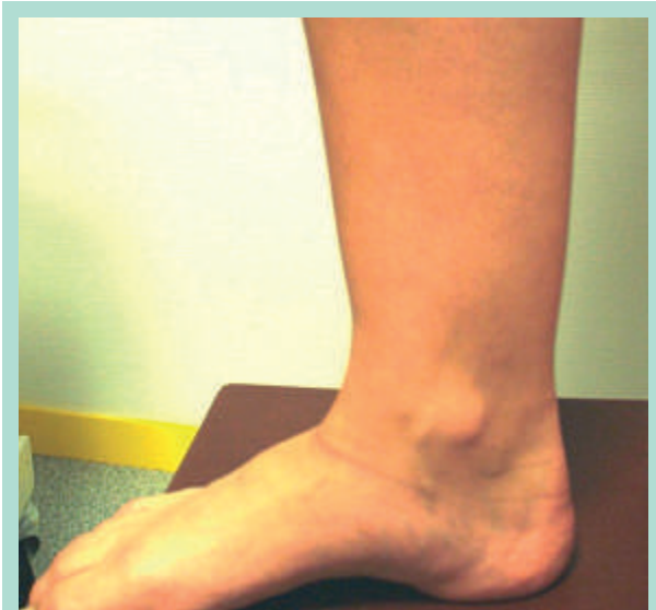
FIGURE 1 : Lipœdème.