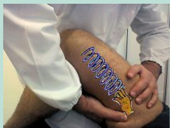
FIGURE 4 : Accomplissement de la manœuvre de la figure 3 : les structures musculo-aponévrotiques sont tendues.