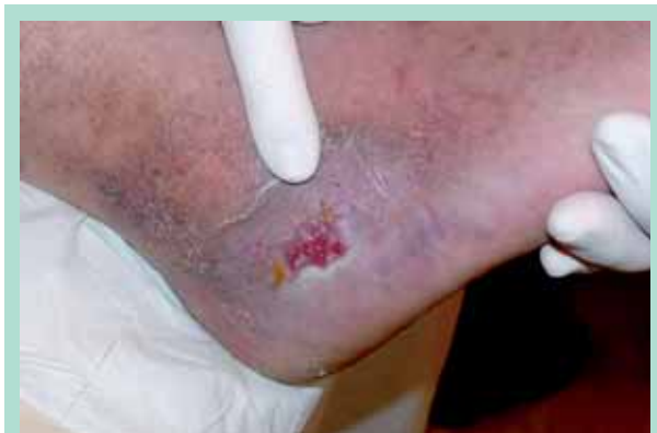
FIGURE 1 : Ulcère post-thrombotique.