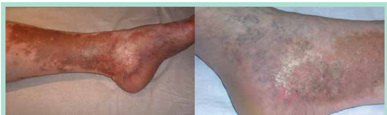
FIGURE 8 : Stade C 4a et b de la classification CEAP.