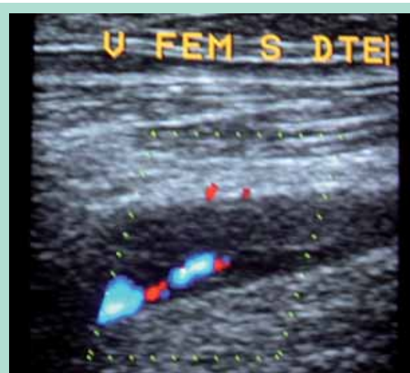
FIGURE 3 : Reperméabilisation partielle de la veine fémorale.

On a montré que le taux d'ulcères veineux continue d'augmenter progressivement au cours des années suivant le diagnostic de TVP avec une incidence cumulée près de 5 % à 10 ans [3].