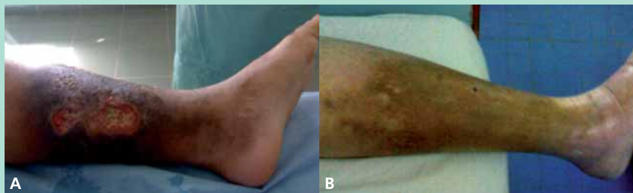
FIGURE 1 : A. Homme, 45 ans. Antécédents : épilepsie sous traitement. Thrombophilie. Diagnostic : SPT. B. Évolution après 1 an de traitement.

Nous avons recensé 35 patients, dont 12 femmes et 23 hommes, l'âge moyen était de 37 ans avec des extrêmes allant de 23 à 55 ans, et le début d'apparition des troubles trophiques allait de 3 mois à 30 ans ! (un ulcère géant depuis plus que 30 ans, voir Figure 1A ).