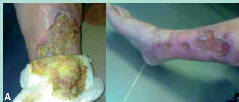
FIGURE 2 : A. Femme, 30 ans. Antécédents : maladie de Behçet, TVP à répétition. Diagnostic : SPTVP. B. Greffe de peau au 6 e mois + traitement de la maladie de Behçet.