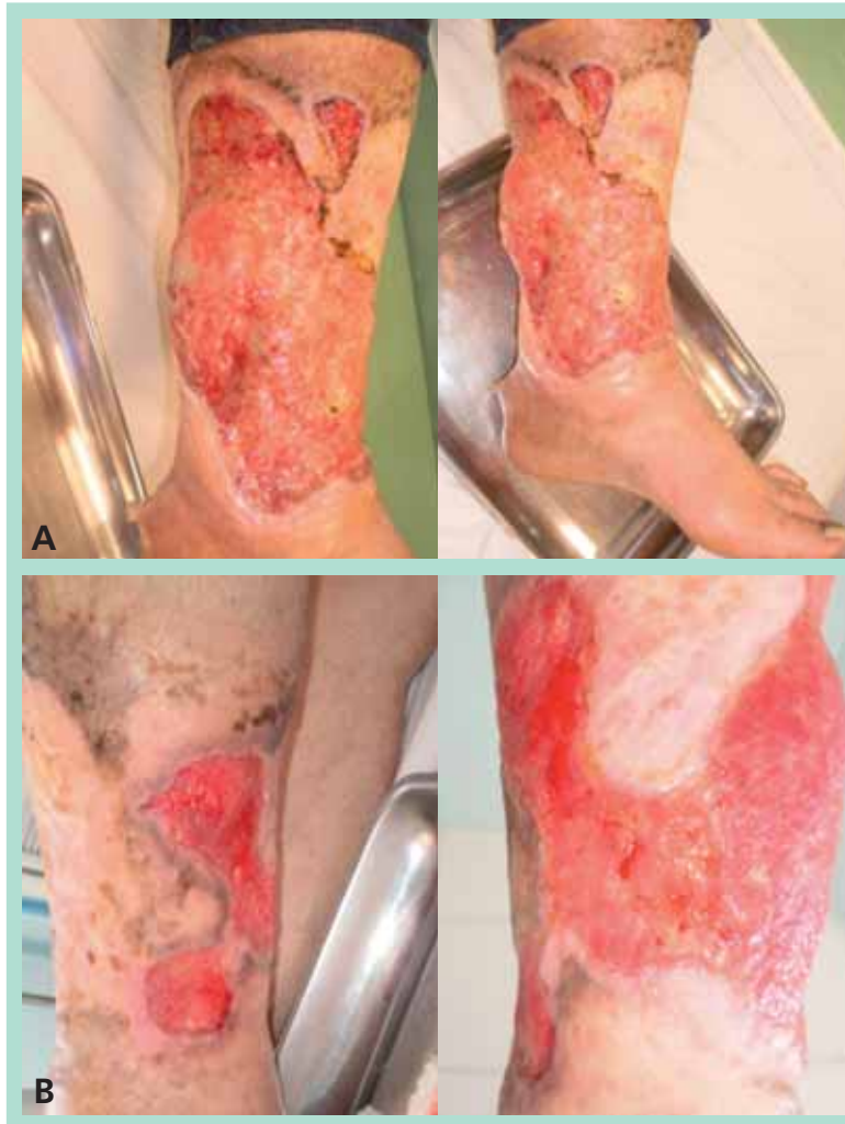
FIGURE 3 : A. Homme, 52 ans, sans antécédents particuliers. Diagnostic : insuffisance veineuse superficielle. B. Résultat après cure de varice + contention élastique et pansements quotidiens.

L'origine veineuse était confirmée par un écho-Doppler veineux réalisé par un personnel entraîné et complété par un écho-Doppler artériel pour éliminer toute artériopathie associée.