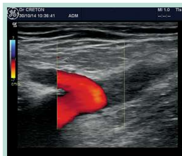
FIGURE 5 : Image échodoppler couleur postopératoire d'une TEV (ClosureFast™).

– mais on peut faire ce stripping avec une simple phlébectomie inguinale si les circonstances anatomiques le permettent, pour extérioriser le tronc en-dessous de la crosse, afin de réaliser le stripping habituel de haut en bas à l'aide d'un pin-stripper.