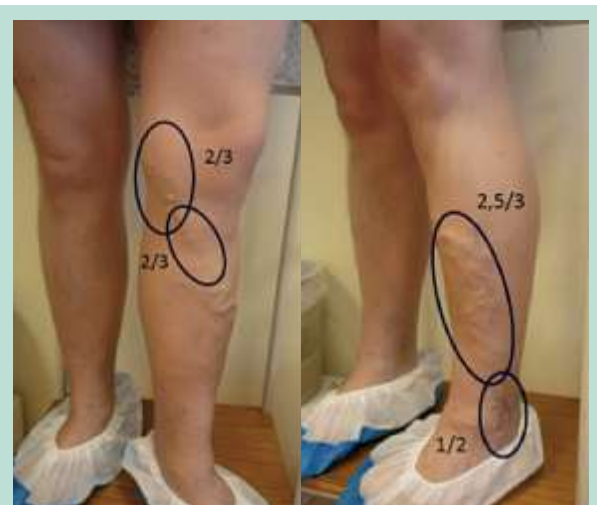
FIGURE 5 : Exemple 1 : calcul du score. 2/3 + 2/3 + 2,5/3 + 1/2 = 7,5/11 C 5 7,5/11

Il n'a de sens que si on le lit en tant que fraction du dénominateur, ou si on le calcule comme index : 7,5/11.