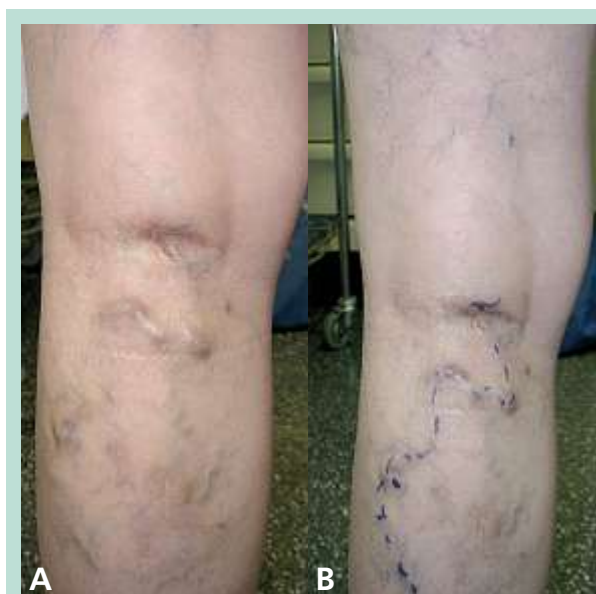
FIGURE 4 : Madame N.

A. Branche variqueuse naissant du cavernome poplité. B. Marquage préopératoire (phlébectomie).