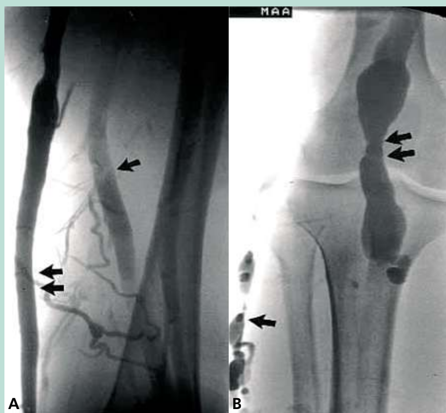
FIGURE 2 : [18].

A. Phlébographie chez une femme de 36 ans avec persistance de la veine sciatique (simple flèche) et dilatation de la grande veine saphène (double flèche). B. Phlébographie chez un homme de 19 ans avec persistance de la veine embryonnaire latérale avec varices multiples (simple flèche) et rétrécissement de la veine poplitée par des bandes fibreuses (double flèche). C. IRM de jambe chez un garçon de 7 ans avec des malformations veineuses étendues de la jambe gauche ; à noter l'existence d'une large veine latérale (flèche).