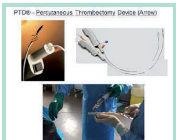
FIGURE 1 : Système de fragmentation mécanique rotationnelle PTD-Trerotola.

Le premier, « microscopique », est fondé soit sur l'effet Venturi (système ANGIOJET de Boston SC), produisant la dissolution du thrombus par jets à 400 km/h de sérum salé (suivi d'aspiration), soit sur le principe Vortex (système ASPIREX de Straub Medical), avec effet de cavitation et dépression (principe de la vis sans fin).