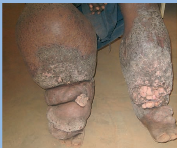
FIGURE 3 : Eléphantiasis bilatéral, prédominant à droite, chez un jeune de 20 ans, à qui on a proposé une amputation (prévue fin février 2009). Donnez une dimension du mollet gauche... Je ne pouvais en faire le tour avec mes bras !