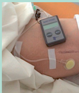
FIGURE 4 : KIKUHIME en place avant positionnement de la compression excentrique standardisée, percé pour le passage de la sonde d'échographie.

Un KIKUHIME a été utilisé pour la mesure de la pression d'interface délivrée par le dispositif de compression. Le capteur était positionné à proximité de la varice étudiée ( Figure 4 ).